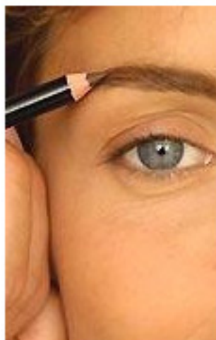
Der Rahmen: die Augenbrauen

Klicken Sie auf die Bilder, um auf die jeweiligen Unterseiten zu gelangen