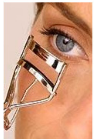
Finish: Die Wimpern

Hier geht es zu Teil III der Serie: Profitipps vom Visagisten