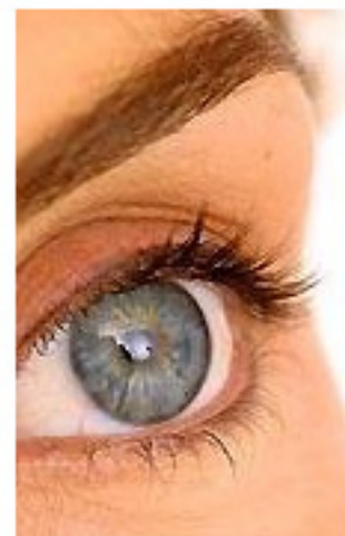
Trendy: Der Eyeliner