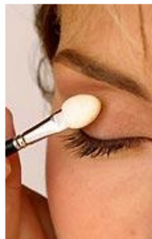
Das Must: Der Lidschatten